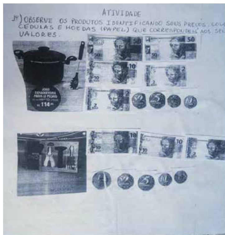
Imagem 2: Atividade com imagens de encartes de lojas.

Conforme registro acima, a educanda encontrava-se em processo de alfabetização e avançada na apropriação da leitura e escrita. Na aula seguinte foi elaborado uma segunda atividade. Esta trouxe uma proposta da Etnomatemática, pois foram utilizados encartes lojas para resolução das questões, conforme imagem 2.